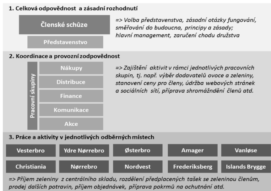
Diagram 2. Organizační struktura družstva KBHFF

Struktura družstva se díky vzrůstajícímu počtu členů postupně vyvíjela a stále se vyvíjí. V současnosti je KBHFF organizováno na třech základních úrovních (Diagram 2). První úroveň zahrnuje představenstvo a členské schůze, které zajišťují chod družstva na nejvyšší úrovni, tj. mají na starosti hlavní rozhodnutí o současných a budoucích aktivitách KBHFF. Druhá úroveň se týká pěti pracovních skupin, které zajišťují aktivity na úrovni celého družstva v oblasti nákupů a distribuce ovoce a zeleniny, finančních otázek, komunikace se členy a okolím a akcí pořádaných družstvem. Třetí úroveň se pak vztahuje k 10 odběrným místům situovaným v různých částech Kodaně a jejich aktivitám (Diagram 2).